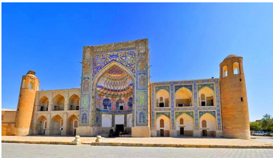
Рисунок 2. Фасад медресе Абдулазизхана II. г.Бухара.

В декорировки медресе: в росписях, в отделке майоликой и мозаикой, в качестве работ, в подборе цветов отчетливо просматривается хороший вкус и высокое мастерство исполнителей. Учитывая, что в монументальной росписи с применением кизил-кисака с позолотой медресе Абдулазизхана носило ещё одно название – “Заргарон”, т.е. “ювелиров”.