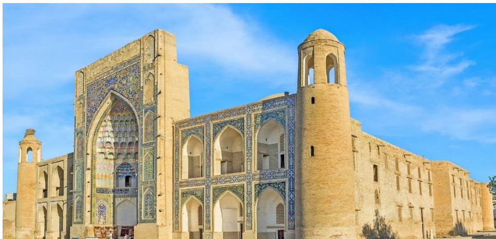
Рисунок 1. Медресе Абдулазизхана II. Бухара

Во время похода Абдулазиз был провозглашен ханом в Ходженте. Нодир, бывший в то время на охоте в Каршинской степи, узнав об этом, поспешно отправился в Балх, а Абдулазиз – в Бухару, где его избрание ханом было окончательно санкционировано знатью.