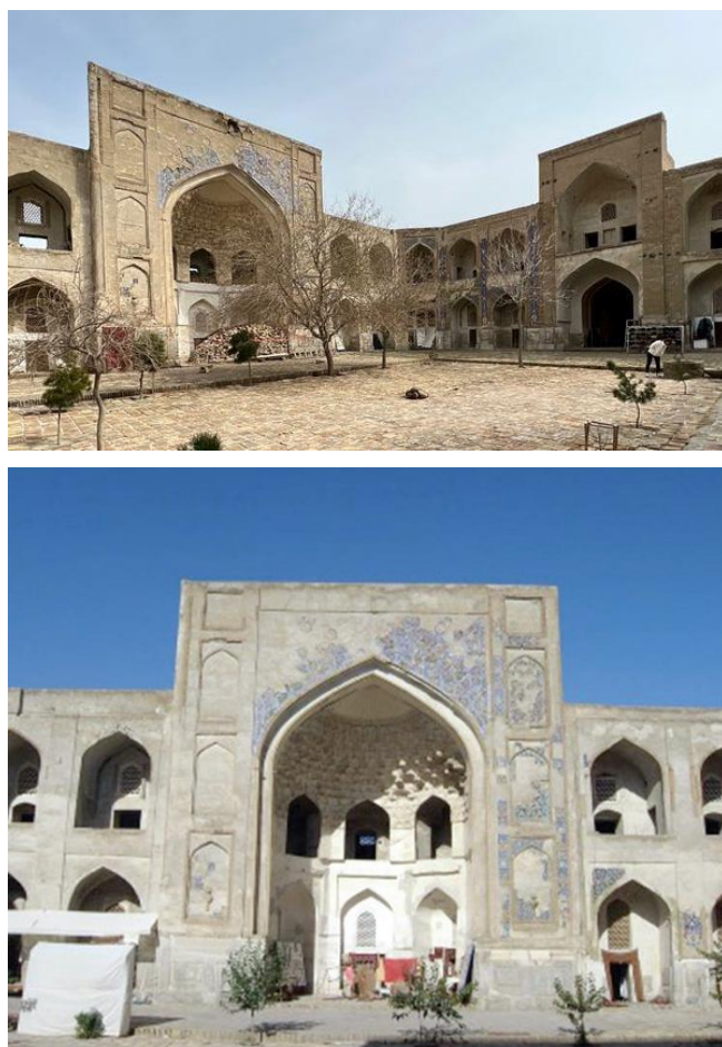
Рисунок 5. Внутренний двор медресе.

Этот памятник архитектуры по праву считается наивысшим достижением в зодчестве Бухары XVI-XVII вв. Развернутый фасад оформлен традиционным высоким порталом и фланкирован башнями, между которыми расположены двухэтажные лоджи ниши. На его оси лежит трехкупольный вестибюль. Средний купол представляет собой соединение четырех пересекающихся арок с заполнением промежутков ребрами. Здесь с успехом применена система подобно мечети Калон и медресе Мири-Араб. В углах располагаются половинки сомкнутых сводников из облицованного кирпича с контурным рисунком из синих поливных кирпичиков.