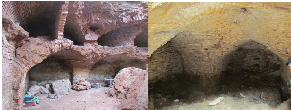
Рис 6. Конструкция перекрытия западного караван-сарая.

Дыры в стенах свидетельствуют о том, что они были закрыты в целях защиты от дождевой воды. Потолок «сторожевой» комнаты отделан сталактитовой композицией [4, с. 177,178]. Во время ремонтных работ, проведенных в XVII в., правая и левая стороны были подняты путем заливки гравием. Позже, в советское время работы по реконструкции были продолжены, верхний уровень моста снова был приподнят, покрыт асфальтом, бордюр был залит бетоном. В результате проезда большегрузного транспорта по мосту с левой стороны образовался осадок и образовалась яма диаметром 60 см (Рис 6).