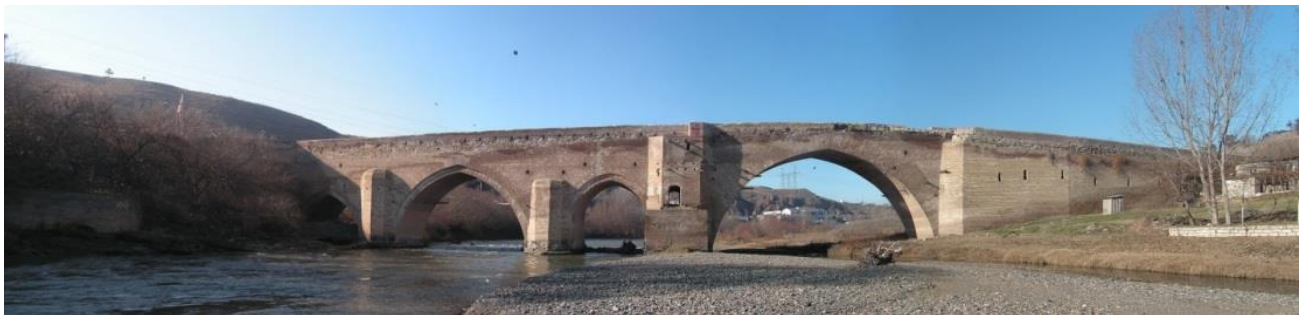
Рис 1. Вид на мост с юга.

Наибольшее развитие в средние века получают многопролетные мосты, пролеты которых а) идентичны, б) нарастают к берегу с высоким рельефом, в) динамично нарастают к центру, г) различны [1,с.118]. К последним принадлежит мост «Сыныг –керпю» на Храм-чай (XIV в.), один из немногих, почти полностью сохранивших свой первоначальный образ. Второе название моста на караванной дороге - «Красный мост», так как основным строительным материалом является кирпич (фото 1).