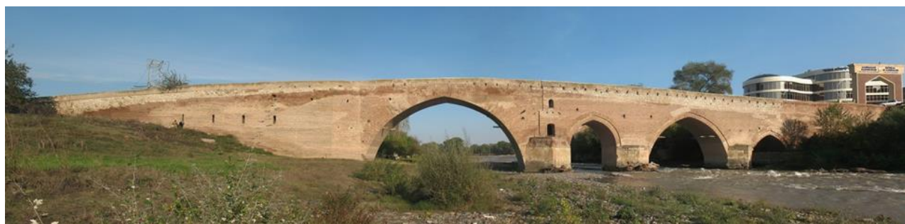
Рис 3. Вид моста с северной стороны.

На правом и левом берегу моста имеются просторные помещения. Площадь помещения с правой стороны составляет 116 \text{ м}^2 , с левой стороны – 166 \text{ м}^2 [8,с.-106,107,7-№31] (Рис 4).