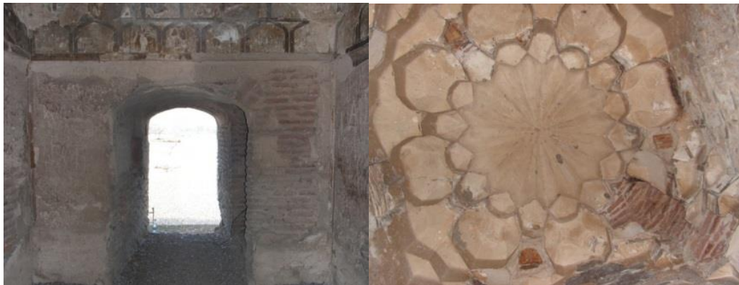
Рис 5. Вид на помещение охраны с севера и с юга.

На левом устое большой арки моста расположено помещение для охраны. Вход в караван-сарай был с берега, а в «сторожевую комнату» спускались по лестнице через мост. Лестница от мостика до «сторожевой» имеет ширину 70-80 см и высоту 20-30 см. Площадь «сторожевой» комнаты составляет 8 м 2 . Она имеет дверь как на верхний, так и на другой берег реки (рис 5).