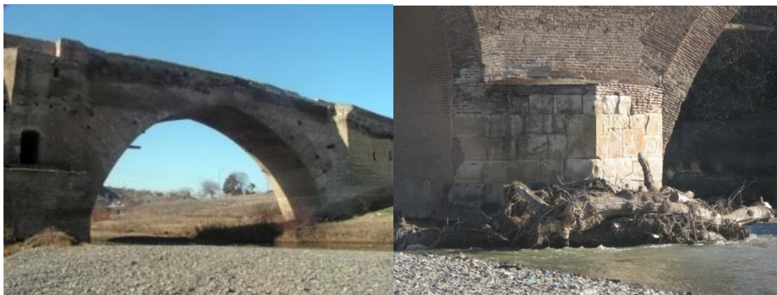
Рис 2. Самый крупный волнолом моста.